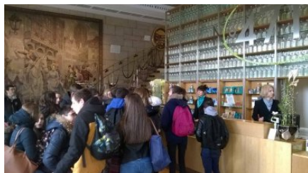
La boutique d'eau de Cologne

Ils étaient logés par leurs correspondants allemands, eux-même accueillis par nos troisièmes en début d'année. Leur première excursion a eu lieu à Düsseldorf, la capitale de la région Rhénanie du Nord-Westphalie, ils ont visité le stade de foot ESPRIT-ARENA. La seconde sortie, c'était à Cologne, où ils ont visité le musée du sport. Ils ont également pu acheter de petits flacons d'eau de Cologne en souvenirs.